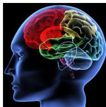
De werking van ons brein tijdens stress

Weerbaarheid berust op drie pijlers namelijk fysiek, moreel en mentaal. Is één van de drie uit evenwicht dan kun je nooit optimaal presteren of het gewenste resultaat bereiken. Groei is ingegeven door je veerkracht en vakmanschap. Is er geen veerkracht meer of bereidheid om het vakmanschap te vergroten is de bloei eruit en blijven resultaten uit. Als Good Work Personnel Development trainen en adviseren we mensen en organisaties o.a. om deze veerkracht te optimaliseren tijdens crisis.